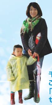
千葉駅から乗車した母子。これから買い物予定という。「子供がモノレール好きで、せがまれて乗りにきました」