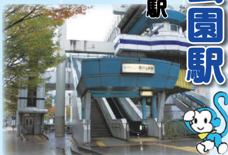
駅は葭川の上にある。繁華街への利便性は高い